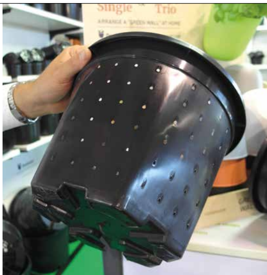
Pojemnik do uprawy roślin iglastych z oferty firmy DonKwiat