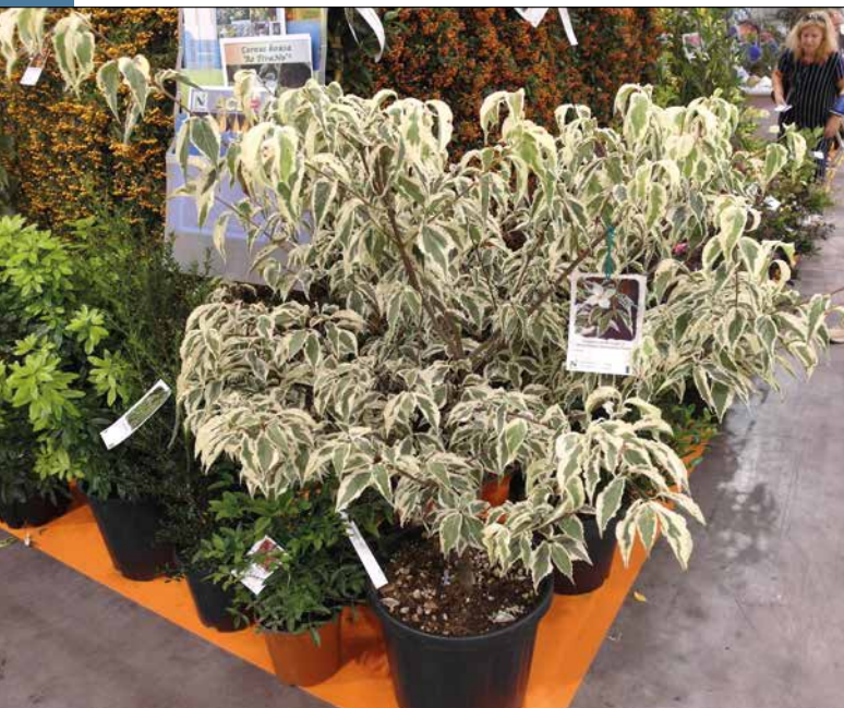
Dereń kousa 'Re TivaNo'®