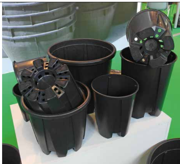
Pojemniki z serii Varia, zapobiegające skręcaniu się korzeni