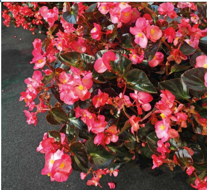
Begonia Sensy Chocolate 'Pink'