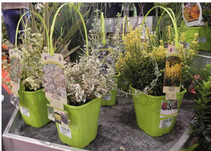
Etykiety z podpowiedzią, w towarzystwie jakich roślin będzie dobrze wyglądał kupowany okaz