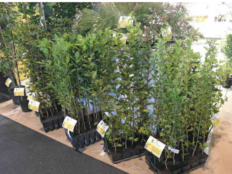
... jak i materiał do dalszej produkcji