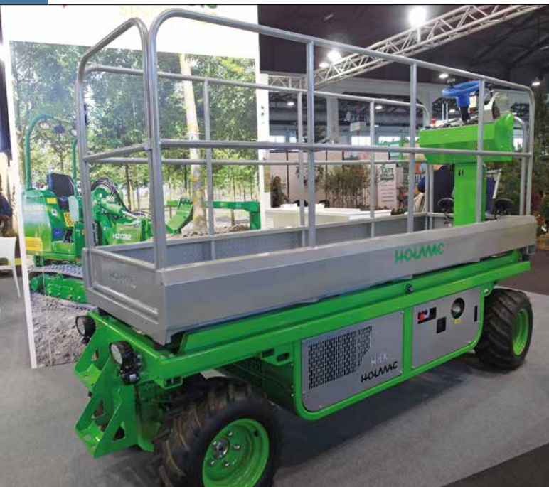
Samojezdna platforma HBK 4 z firmy Holmac