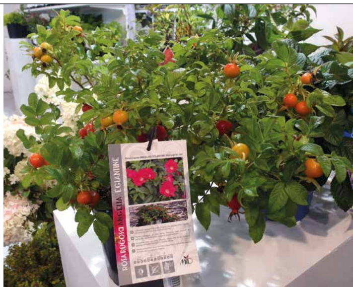
Róża pomarszczona Angelia® Eglantine

W Padwie swoją ofertę zaprezentowała też firma Floramiata, jeden z największych w tym kraju producentów roślin wykorzystywanych do dekorowania